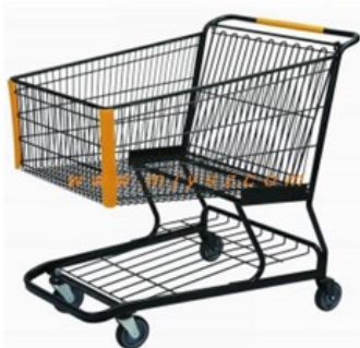
◆ SHOPPING CART

*El tiempo aproximado de entrega es de 2 a 6 semanas*