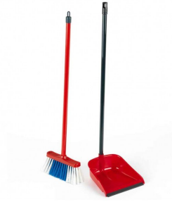
◆ Escoba y Recogedor