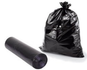
◆ Bolsas de basura