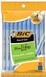
◆ Boligrafos Azules, Negros y de Colores