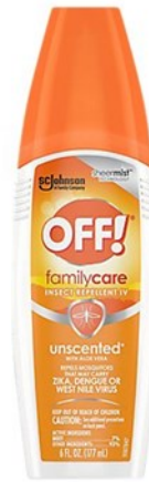
◆ REPELENTE OFF