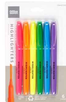
◆ Highlighters de Colores