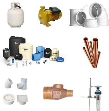
◆ Materiales de Plomeria

*Los precios pueden ser modificados de acuerdo al volumen de compra*