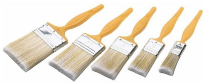
◆ Brochas para pintar