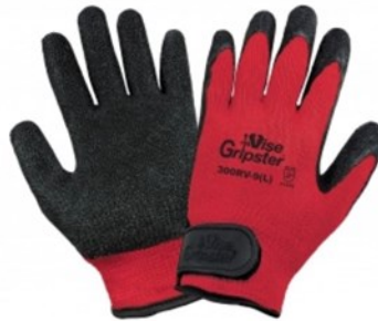
◆ GARDEN GLOVES