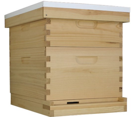
◆ Cajas de Abejas