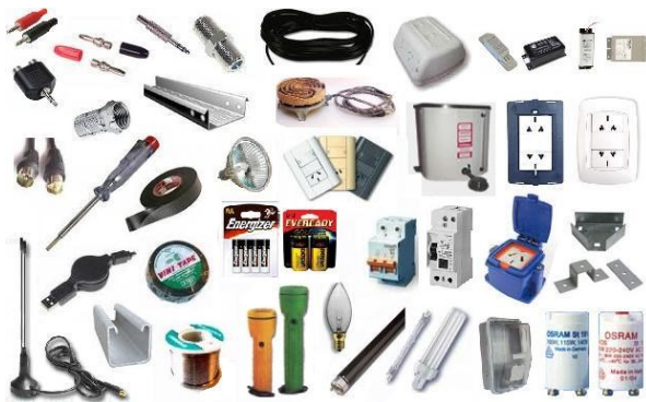
◆ Materiales de Electricidad