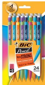
◆ Lapices Punta 5,7 y 9