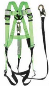
◆ HARNESS KIT

*Los precios pueden ser modificados de acuerdo al volumen de compra*