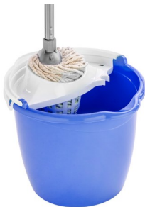
◆ Balde para Mapo