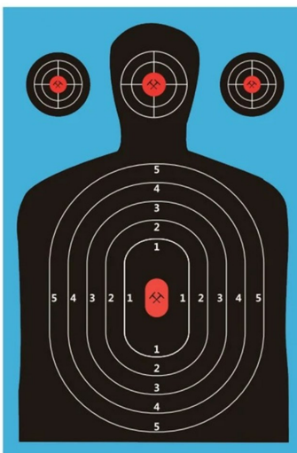
◆ Tarjetas de Tiro

*Los precios pueden ser modificados de acuerdo al volumen de compra*