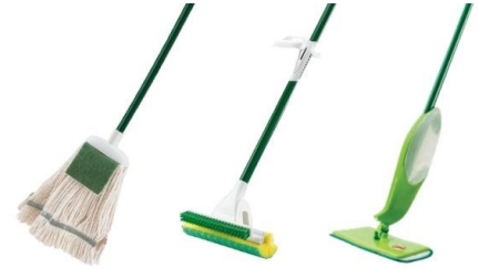
◆ Mapo y Limpiadores de Piso