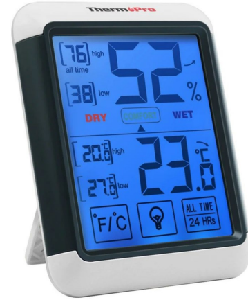
◆ Termómetros Ambientales Digitales