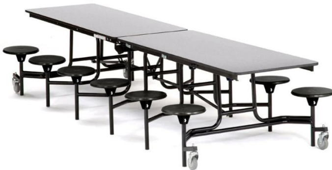
◆ Mesas para Comedores