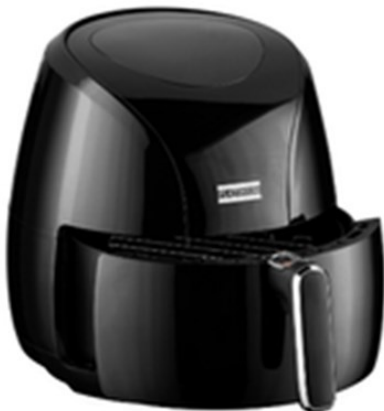
◆ Horno Air Fryer

*Los precios pueden ser modificados de acuerdo al volumen de compra*