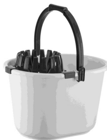
◆ Balde para Mapo

*Los precios pueden ser modificados de acuerdo al volumen de compra*