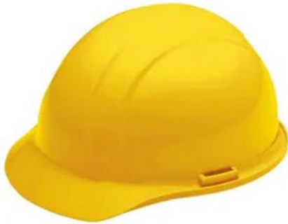
◆ YELLOW LIBERTY SAFETY HELMET