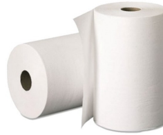
◆ Papel Servilleta