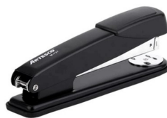
◆ Goma, Tape, Carpetas, Grapadora etc