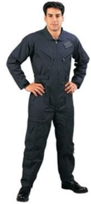
◆ MECHANIC COVERALL