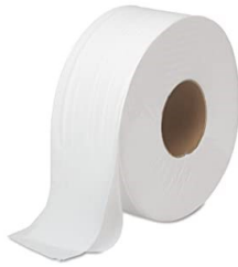
◆ Papel de Inodoro