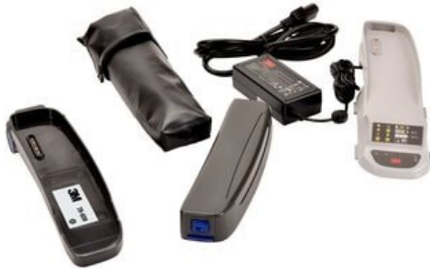
◆ 3M™ Breathe Easy™ Battery Adapter Upgrade K RBE 600