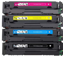
◆ Toner Negro y de Color