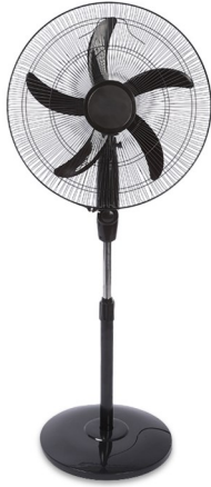
◆ Abanicos 3 en 1