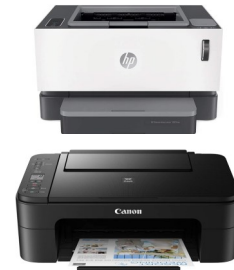
◆ Printer Blanco y Negro/ Color